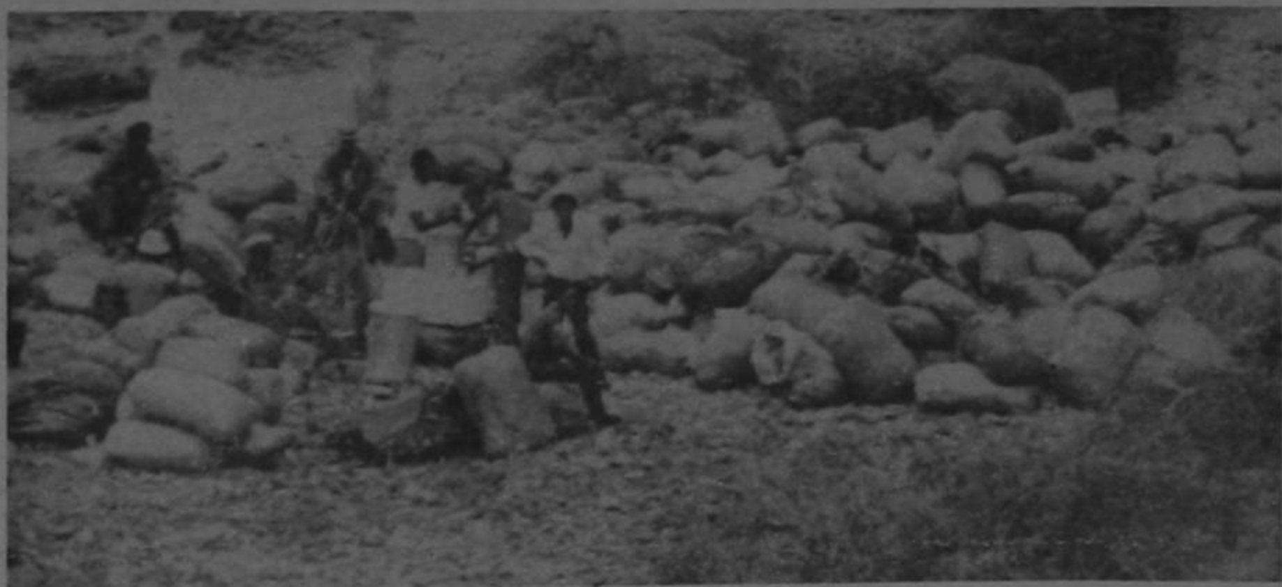
MONTAÑAS DE MARIHUANA. — Cuarenta toneladas de marihuana colombiana apiladas en una remota isla de la cadena de las Bahamas. Se considera que las toneladas, valuadas en 22 millones de dólares constituyen la mayor captura de la droga jamás hecha.