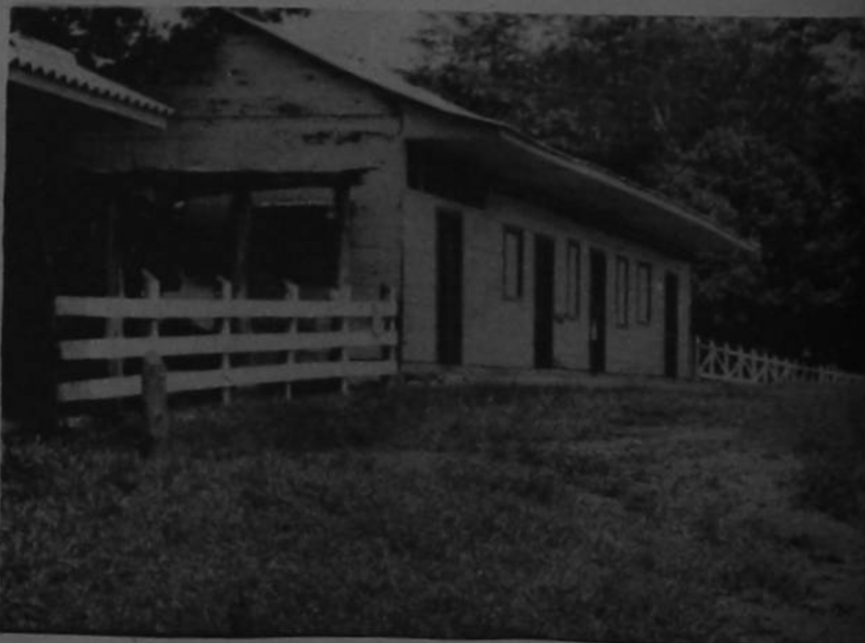
La calle principal de Chira con un negocio. La gente quiere que haya progreso pero todo el mundo le ofrece cosas y nadie les cumple nada.