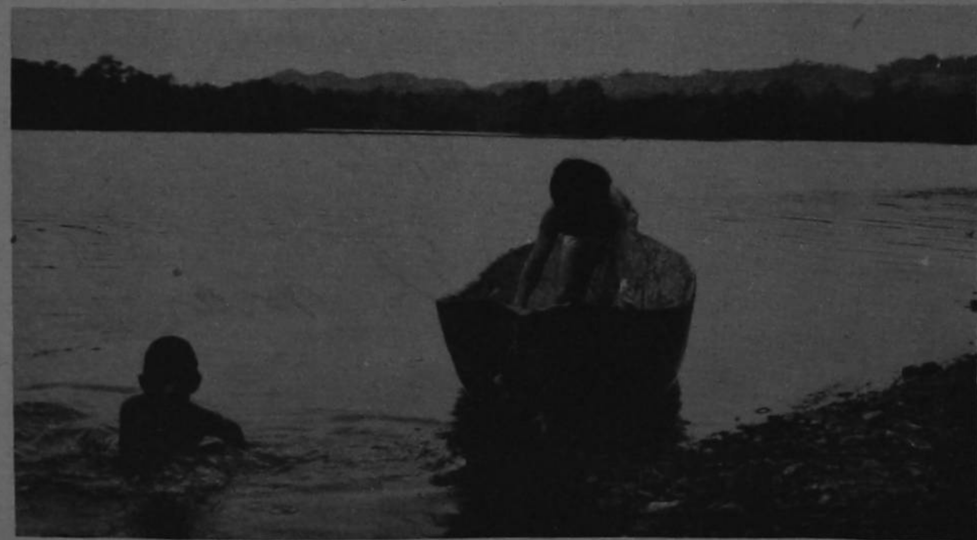
El mar es todo para los isleños: vida, camino, esperanza, presente y futuro. Los niños retozan en el agua a la par del cayuco de espavil medio destartado.