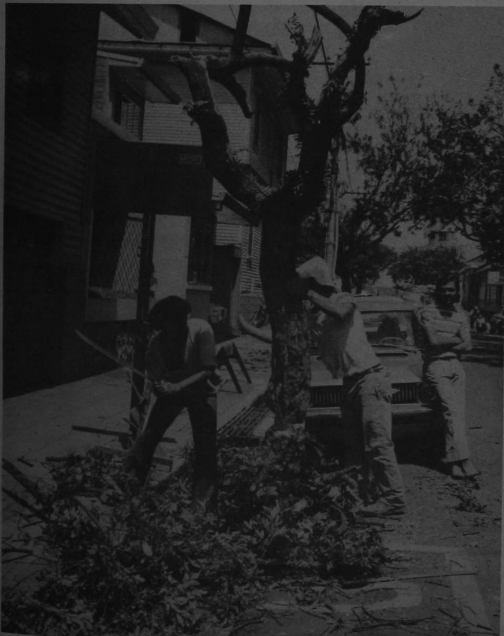
Ayer comenzaron las autoridades del Tránsito a talar en las calles y avenidas de Barrio Amón y otros lugares de la ciudad de San José. Se alega que "es para mejorar la visibilidad a los automovilistas", pero la capital avanza así hacia su desolación total.