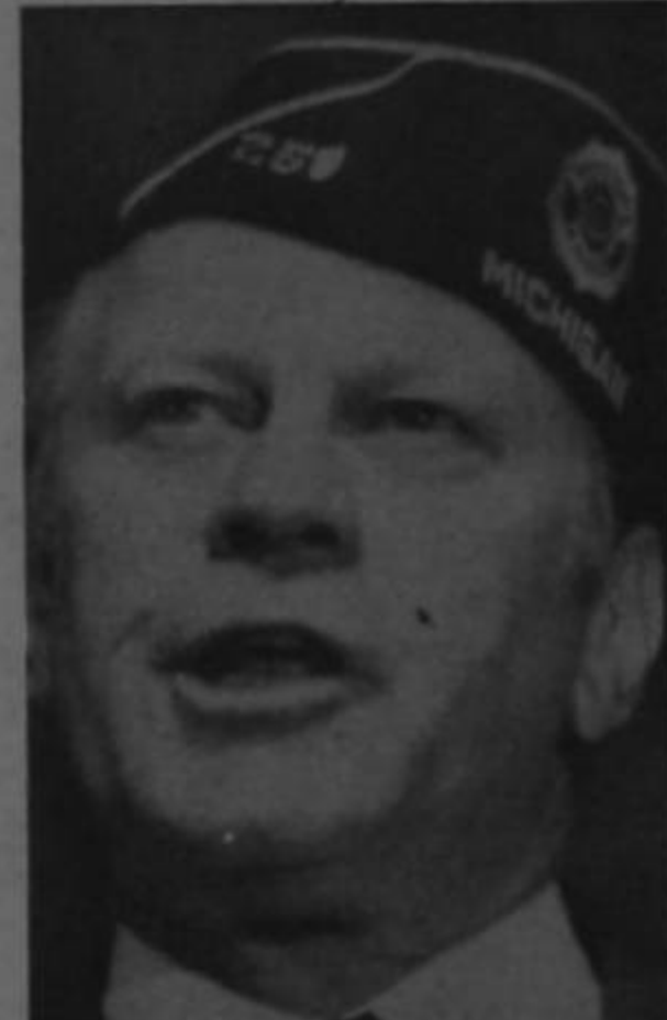
El presidente Ford, con su gorro de la Legión Americana, habla en la convención anual de la institución.

Antes del discurso en la Legión Norteamericana, Ford habló durante un desayuno con unos 90