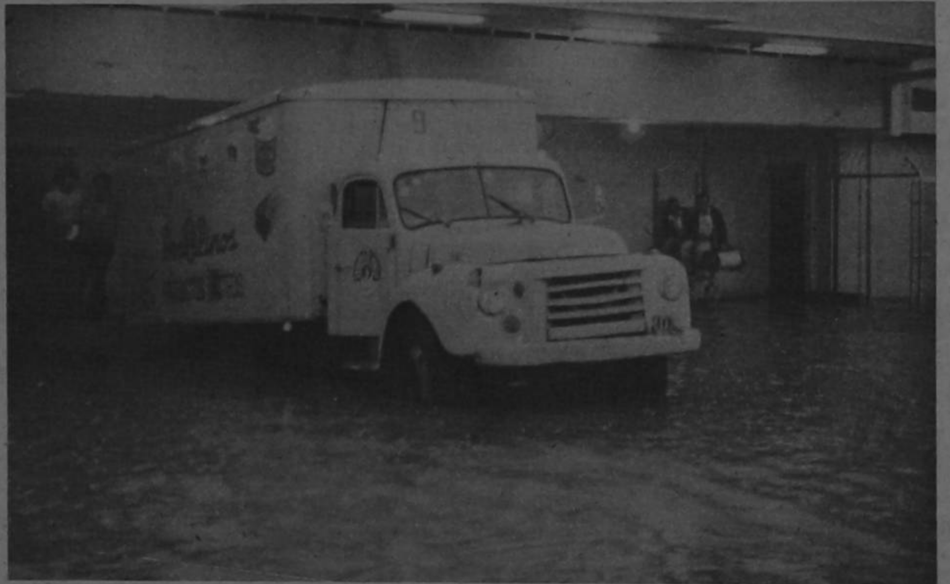
Las inundaciones vespertinas en San José han causado problemas a diferentes instituciones. La Cooperativa de Productores de Leche Dos Pinos en su parte occidental se ha anegado dos días consecutivos.

"Por la gravedad del hecho —añade— el Consejo Universitario en sesión ordinaria acordó solicitar respetuosamente se aceleren los trámites de la investigación y se hagan todos los esfuerzos posibles para encontrar a los culpables de esta tentativa de homicidio".