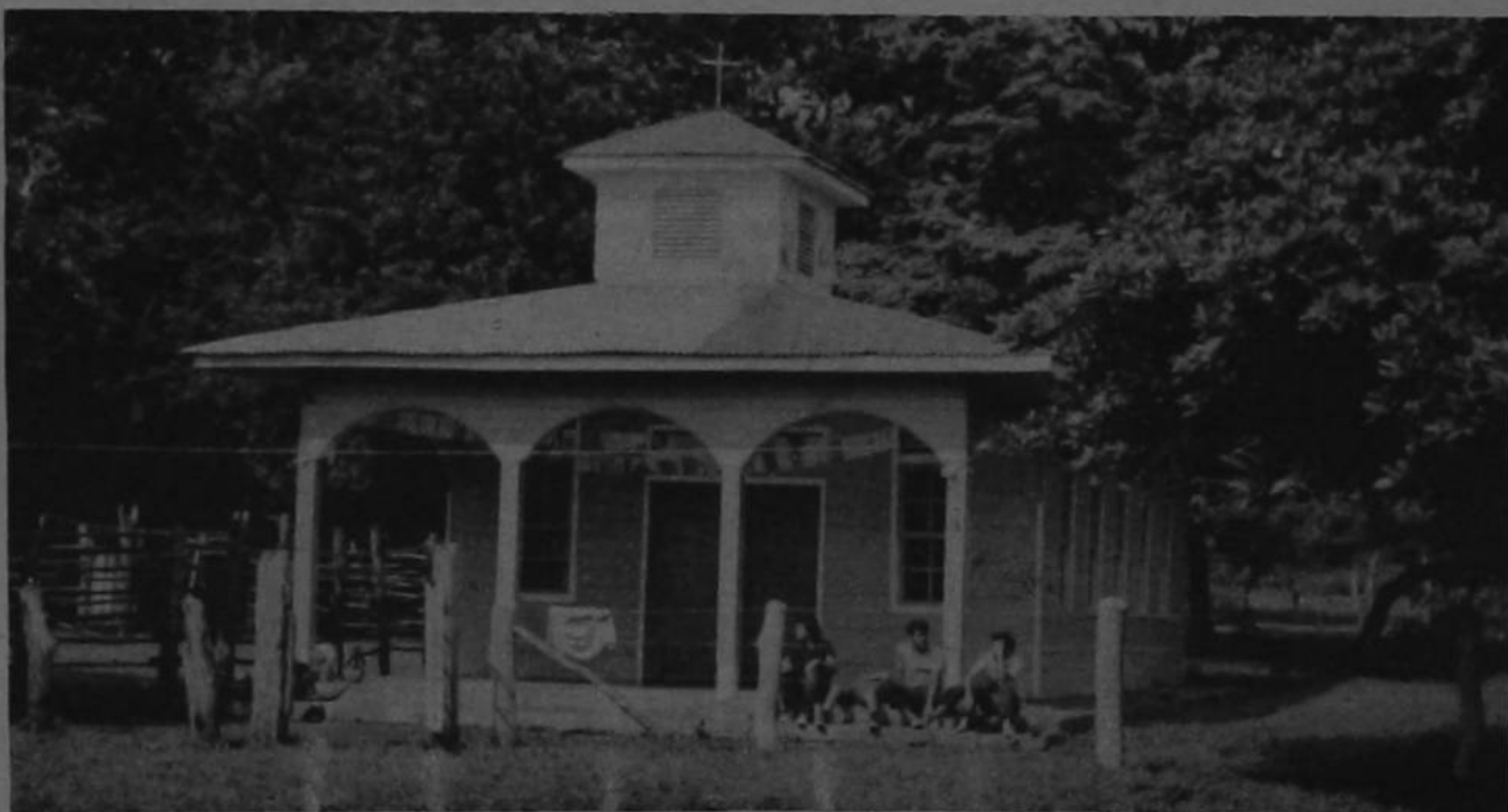
Un pequeño templo de madera fue construido en la isla, pero solamente llega un sacerdote cada tres meses y el resto del tiempo la gente vive alejada de la mano de Dios.

Y esta es la visión sintética de la población de la mayor isla que tiene Costa Rica en el Pacífico.